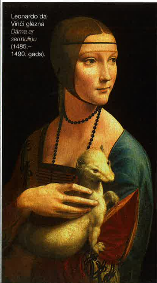
Leonardo da Vinci glezna Dāma ar sermulīnu (1485.–1490. gads).