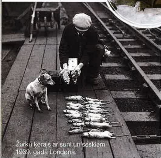
Žurku ķerājs ar suni un seskiem 1939. gadā Londonā.